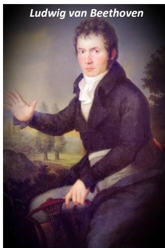
Ludwig van Beethoven

Eintritt frei, um Spenden für die Kulturstiftung im Wohnstift wird gebeten!